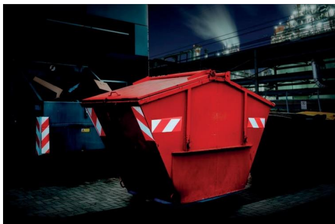
Oznakowanie ostrzegawcze kontenera - taśma Chevron biało/czerwony Avery Dennison

* Należy pamiętać, że stosowanie oznakowania ostrzegawczego koloru żółtego fluorescencyjnego/czerwonego na pojazdach służb ratunkowych wymaga specjalnego zezwolenia.