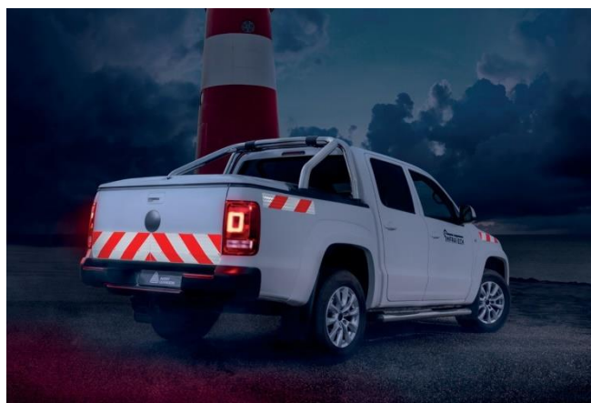
Oznakowanie pojazdu zgodnie z normą DIN30710 i TPESC-B - taśma Chevron biało/czerwony Avery Dennison

ZASTRZEŻENIE PRAWNE - wszystkie oświadczenia firmy Avery Dennison, informacje techniczne i zalecenia są formułowane na podstawie badań uznawanych za wiarygodne, jednakże nie stanowią żadnej formy gwarancji. Wszystkie produkty firmy Avery Dennison są sprzedawane przy założeniu, że nabywca niezależnie ustali ich przydatność do konkretnych celów. Wszystkie produkty Avery Dennison są sprzedawane z zastrzeżeniem ogólnych warunków sprzedaży Avery Dennison, patrz http://terms.europe.averydennison.com