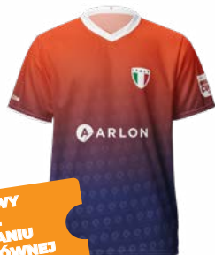
LIMITOWANA EDYCJA KOSZULKI Z WYBRANĄ FLAGĄ ARLON WRAP CUP

+ DARMOWY UDZIAŁ W LOSOWANIU NAGRODY GŁÓWNEJ