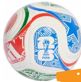
PILKA FIFA 2026 ARLON WRAP CUP

+ DARMOWY UDZIAŁ W LOSOWANIU NAGRODY GŁÓWNEJ