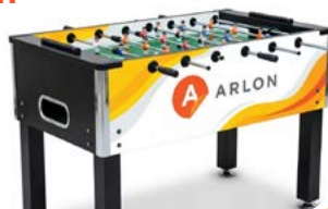
PERSONALIZOWANY STÓŁ DO PIŁKARZYKÓW Z TWOIM LOGO

NA KOŃCU PROMOCJI WYŁONIMY JEDNEGO ZWYCIĘZCĘ NAGRODY GŁÓWNEJ SPOŚRÓD WSZYSTKICH UPRAWNIONYCH UCZESTNIKÓW