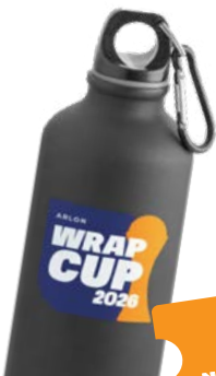
BIDON ARLON WRAP CUP

+ DARMOWY UDZIAŁ W LOSOWANIU NAGRODY GŁÓWNEJ