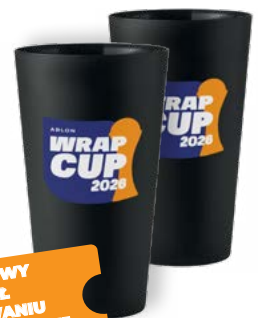
2 X KUBKI ARLON WRAP CUP

+ DARMOWY UDZIAŁ W LOSOWANIU NAGRODY GŁÓWNEJ